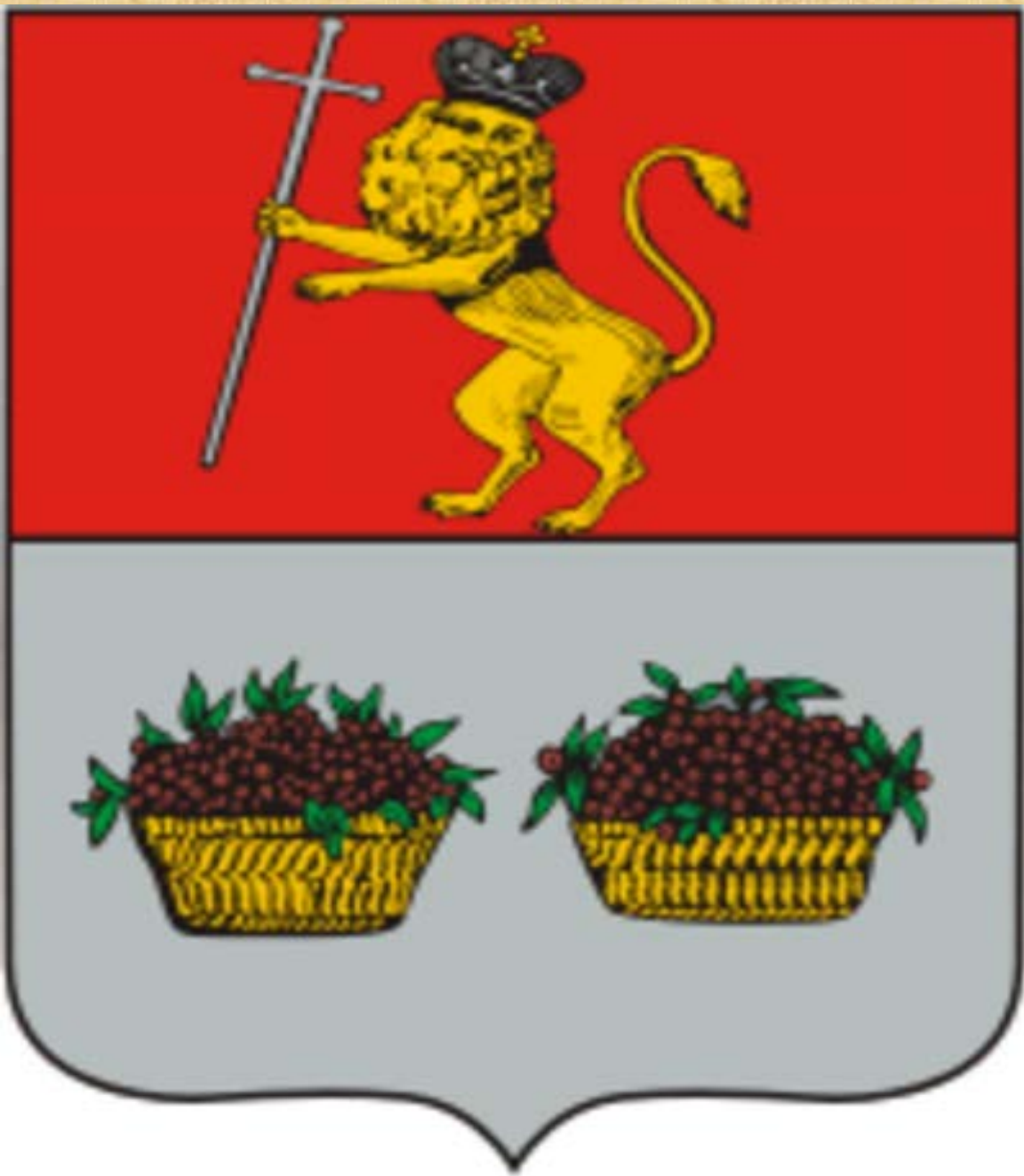
Герб города Юрьев- Польский